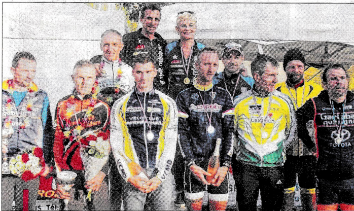
Les champions régionaux, dont trois Vauclusiens, ont été les plus agiles sur ce parcours 100 % cyclo-cross.